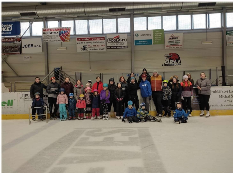
Text a foto: Eliška Čapková

Zima skončila, a i v Hale B. Modrého se koncem března ledová plocha každoročně rozmrazí. Budeme se tedy těšit na příští zimu, abychom zase oprášili svoje dovednosti a naši omladinu vedli k tomuto sportu, který podporuje nejen obec Lubník, ale také TJ Sokol Lubník.